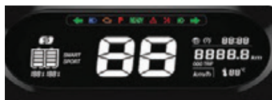
کیلومتر تمام دیجیتال